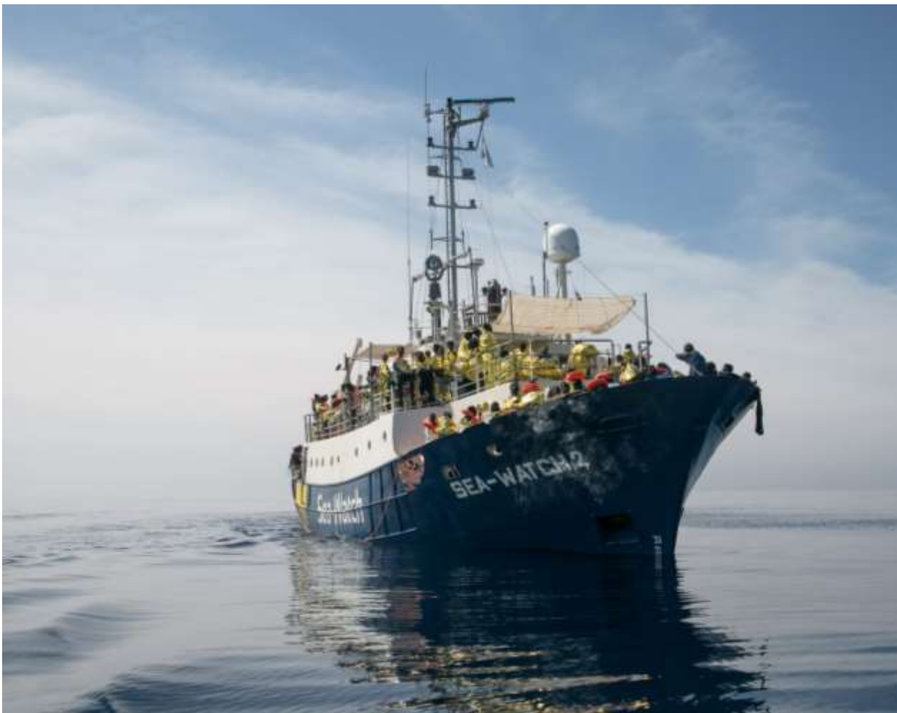
Rettungsboot Sea Watch 2 mit Geretteten

Viele Organisationen haben daher eigene Rettungsboote in die betroffenen Gebiete des Mittelmeers geschickt, zum Beispiel die Vereine Ärzte ohne Grenzen und Sea-Watch. Sie versuchen, das Meer zu überwachen, Flüchtlinge zu retten und ans Festland zu bringen. Die italienischen Behörden prüfen zurzeit, Sea-Watch wegen Zusammenarbeit mit Schleppern anzuklagen, um die Fortsetzung dieser Arbeit zu verhindern.